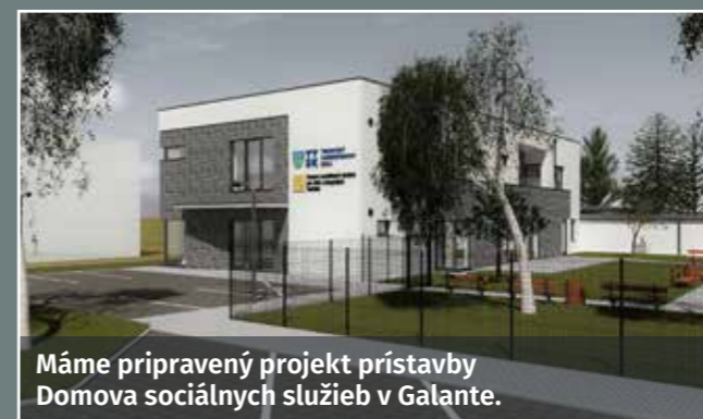
Máme pripravený projekt prístavby Domova sociálnych služieb v Galante.