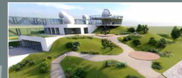
Unikátnym zámerom je 10-miliónová modernizácia hviezdárne a planetária v Hlohovci, ktoré dostaneme medzi európsku špičku.