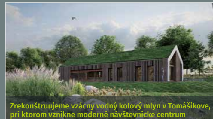
Zrekonštruujeme vzácny vodný kolový mlyn v Tomášikove, pri ktorom vznikne moderné návštevnícke centrum