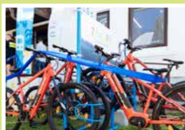
Z dotačných schém sme podporili napríklad zriadenia požičovne elektrobicyklov v Smrdádoch alebo organizáciu pretekov Okolo Slovenska