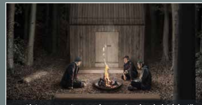
V Malých Karpatoch postavíme modernú turistickú útulňu.