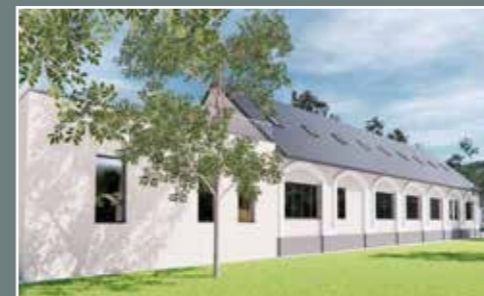
V Moravskom Sv. Jáne postavíme nové zariadenie sociálnych služieb.

Spolu s tímom sme popri dokončení mnohých projektov za päť rokov nazbierali aj kopec skúseností, užitočnú spätnú väzbu a nové nápady. Viaceré naše plány presahujú horizont končiaceho sa volebného obdobia. Sme pripravení ich zúročiť v ďalšom období. Máme rozpracované konkrétne projekty, ktoré posunú Trnavský kraj dopredu. A máme veľkú chuť ich zrealizovať.