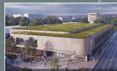
Na Prednádraží v Trnave postavíme športový areál, ktorý bude slúžiť najmä mladým hokejovým talentom.