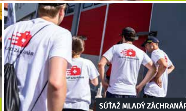
SÚŤAŽ MLADÝ ZÁCHRANÁR