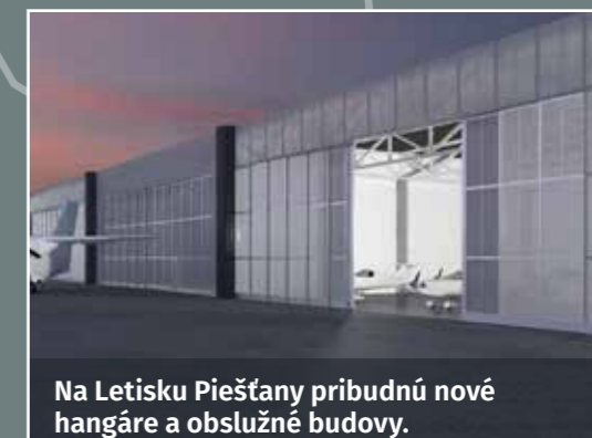
Na Letisku Piešťany pribudnú nové hangáre a obslužné budovy.