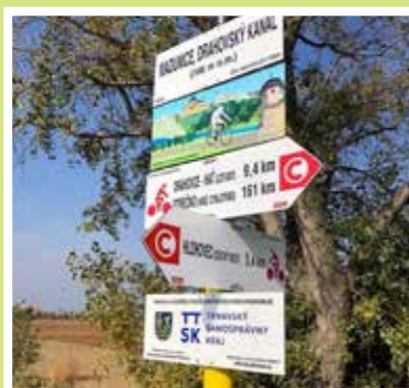
Obnovili sme 473 kilometrov cyklistického značenia. Až 616 kilometrov cyklistických trás sme vyznačili úplne nanovo