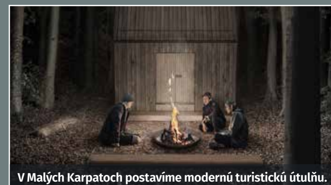
V Malých Karpatoch postavíme modernú turistickú útulňu.