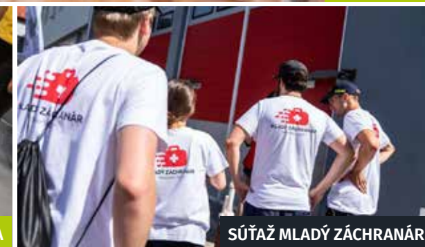
SÚŤAŽ MLADÝ ZÁCHRANÁR