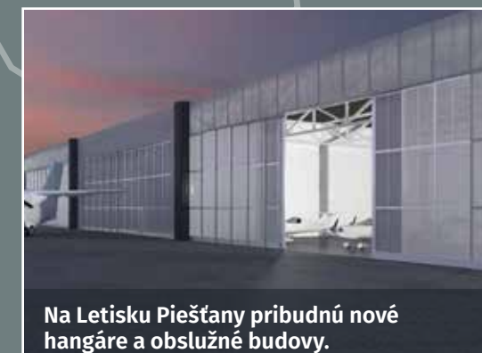
Na Letisku Piešťany pribudnú nové hangáre a obslužné budovy.