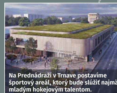
Na Prednádraží v Trnave postavíme športový areál, ktorý bude slúžiť najmä mladým hokejovým talentom.