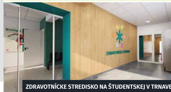
ZDRAVNÍCKE STREDISKO NA ŠTUDENTSKEJ V TRNAVE

Okrem toho budeme aj ďalej účelne prepájať ústavnú a ambulantnú zdravotnú starostlivosť. V spolupráci a pod odbornou garanciou Fakultnej nemocnice v Trnave sa pri tom zameriame na rozvoj následnej, dlhodobej, paliatívnej a ošetrovateľskej starostlivosti prioritne v domácom prostredí. V horizonte roka 2030 budeme pri zabezpečovaní kvalitnej a dostupnej zdravotnej starostlivosti postupovať podľa pripravovanej novej stratégie založenej na dátach.