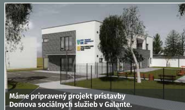
Máme pripravený projekt prístavby Domova sociálnych služieb v Galante.