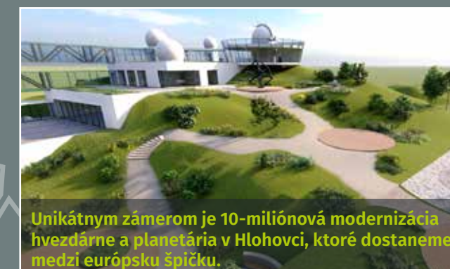
Unikátnym zámerom je 10-miliónová modernizácia hvezdárne a planetária v Hlohovci, ktoré dostaneme medzi európsku špičku.