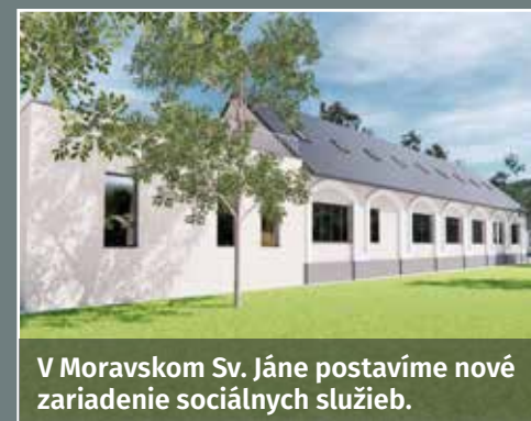
V Moravskom Sv. Jáne postavíme nové zariadenie sociálnych služieb.

Spolu s tímom sme popri dokončení mnohých projektov za päť rokov nazbierali aj kopec skúseností, užitočnú spätnú väzbu a nové nápady. Viaceré naše plány presahujú horizont končiaceho sa volebného obdobia. Sme pripravení ich zúročiť v ďalšom období. Máme rozpracované konkrétne projekty, ktoré posunú Trnavský kraj dopredu. A máme veľkú chuť ich zrealizovať.