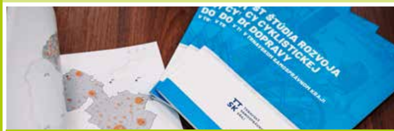
V spolupráci so Slovenským cykloklubom sme vypracovali koncepcný strategický dokument a Cyklokoalícia nám pomohla pri tvorbe unikátnej, na dátach založenej štúdie