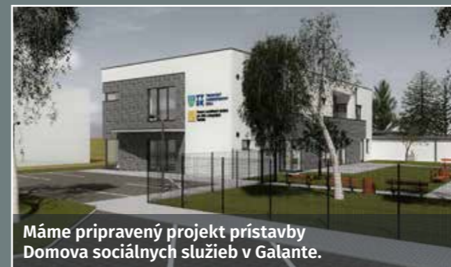
Máme pripravený projekt prístavby Domova sociálnych služieb v Galante.