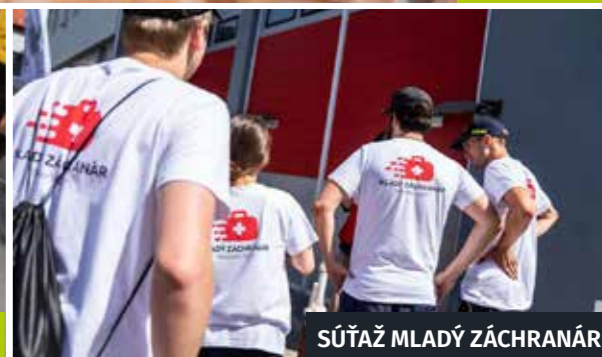
SÚŤAŽ MLADÝ ZÁCHRANÁR