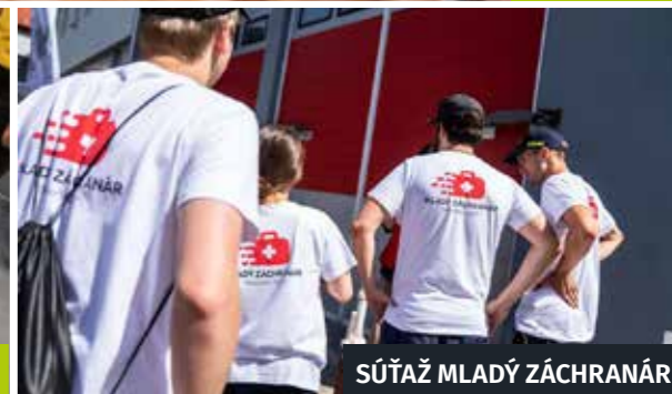
SÚŤAŽ MLADÝ ZÁCHRANÁR