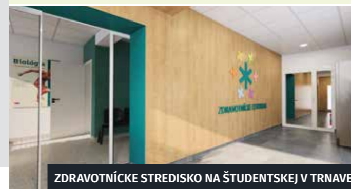
ZDRAVNÍCKE STREDISKO NA ŠTUDENTSKEJ V TRNAVE

Okrem toho budeme aj ďalej účelne prepájať ústavnú a ambulantnú zdravotnú starostlivosť. V spolupráci a pod odbornou garanciou Fakultnej nemocnice v Trnave sa pri tom zameriame na rozvoj následnej, dlhodobej, paliatívnej a ošetrovateľskej starostlivosti prioritne v domácom prostredí. V horizonte roka 2030 budeme pri zabezpečovaní kvalitnej a dostupnej zdravotnej starostlivosti postupovať podľa pripravovanej novej stratégie založenej na dátach.