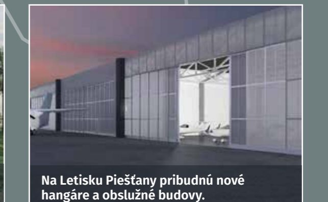
Na Letisku Piešťany pribudnú nové hangáre a obslužné budovy.