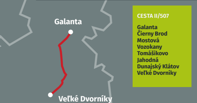
CESTA II/507 Galanta Čierny Brod Mostová Vozokany Tomášikovo Jahodná Dunajský Klátov Veľké Dvorníky

Pripravujeme investičné plány na rekonštrukcie regionálnych ciest a mostov