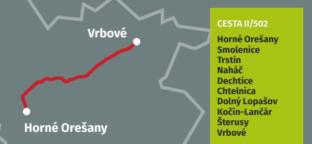
CESTA II/502 Horné Orešany Smolenice Trstín Naháč Dechtice Chlebnica Dolný Lopašov Kočin-Lančár Šterusy Vrbové

Pripravujeme investičné plány na rekonštrukcie regionálnych ciest a mostov